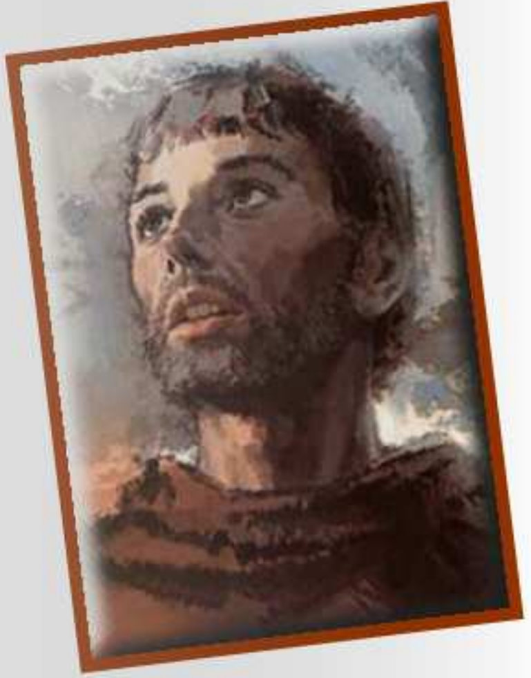
San Francisco de Asís