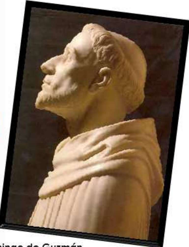
Santo Domingo de Guzmán