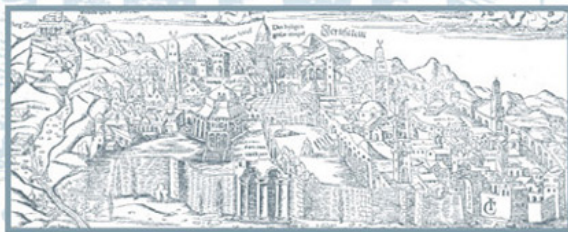
Imagen de fondo: Detalle de Jerusalem civitas sancta . Grabado de Sebastian Münster, alrededor del 1550