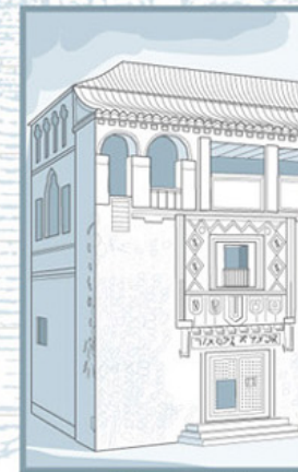
Sinagoga del Tránsito, construida en Toledo en 1357.

El templo por excelencia es el Templo de Jerusalén, del que solamente queda el Muro de las Lamentaciones. Por otro lado, las sinagogas son los lugares en los que se reúne la comunidad judía tres veces a la semana. Durante la oración, los varones deben llevar puesto el «kippah» (pequeño gorro) y el «tallith» (chal rectangular para cubrir los hombros). Allí se debaten cuestiones importantes para la comunidad y son centros de estudio.